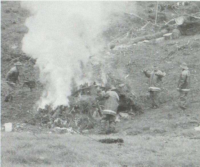
Aufräumarbeiten im geschützten Hochmoorgebiet.