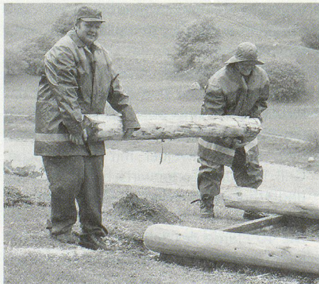
Sandkastenabdeckung für den Spielplatz in Brigels.