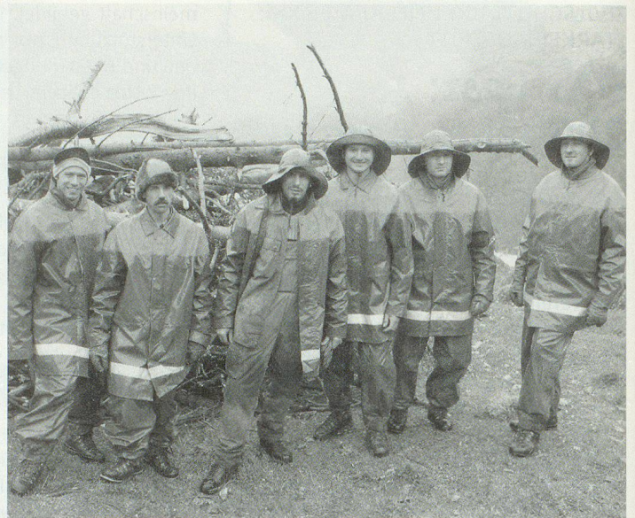
Kleidung wie auf einem Hochseefrachter jedoch knochenharte Arbeit auf 1800 m. ü. M. bei Dauerregen.