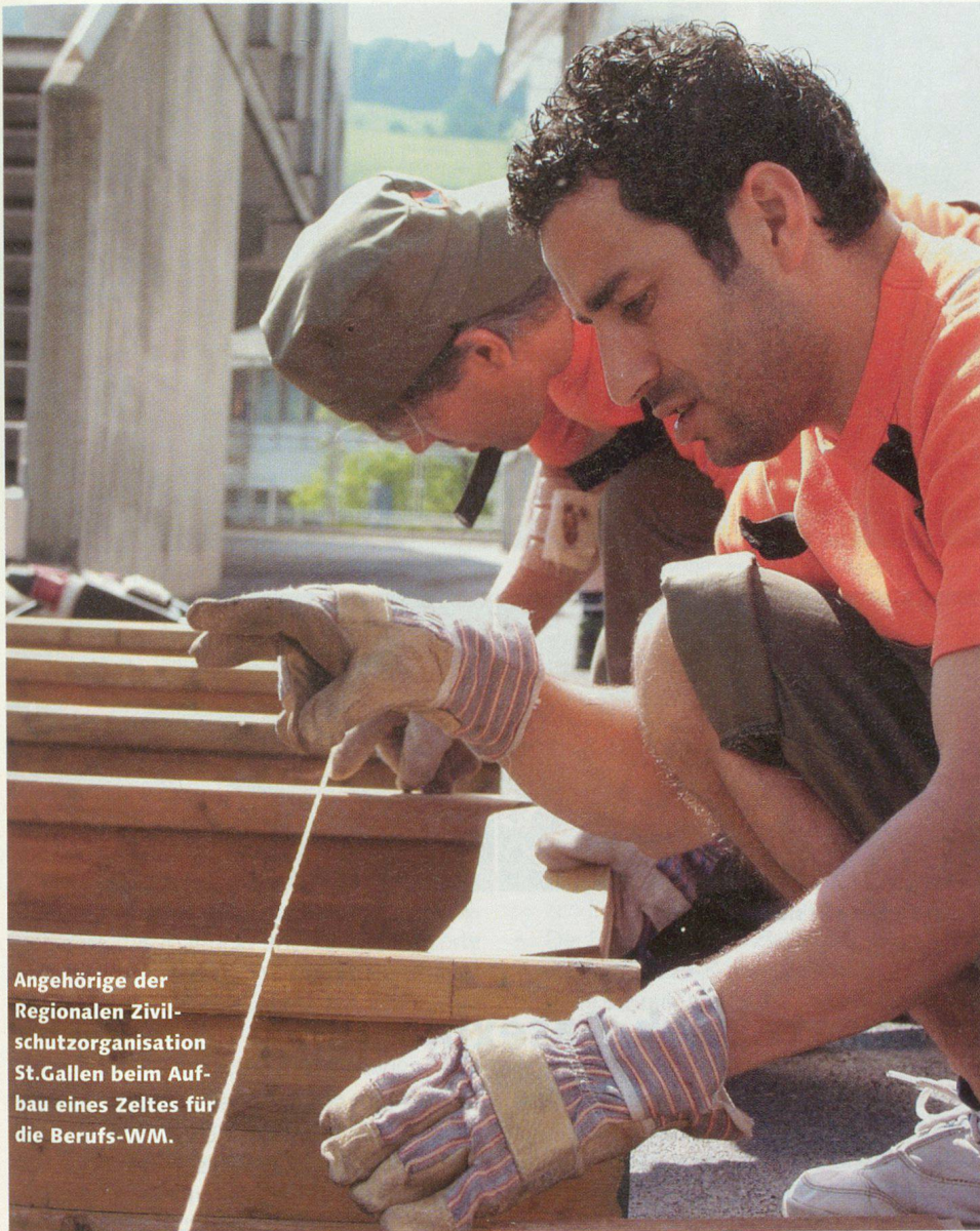
Angehörige der Regionalen Zivilschutzorganisation St.Gallen beim Aufbau eines Zeltes für die Berufs-WM.

Abbau standen einige Zivilschützer zu wenig im Einsatz. Das wiederum war vor allem darauf zurückzuführen, dass zu diesem Zeitpunkt viele von ihnen beim Open-Air Zivilschutz leisteten. Denn auch dort bot die Regionale Zivilschutzorganisation St.Gallen tatkräftig Hilfe.