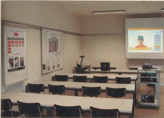
PC- und Theorieraum für den Zivilschutz.