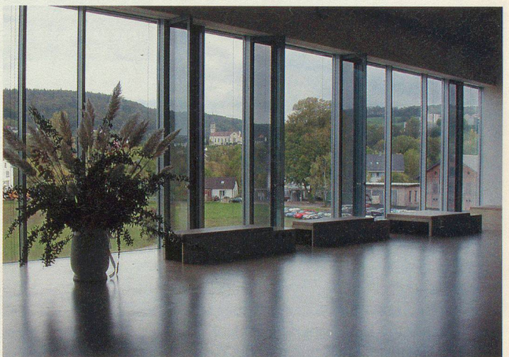
Durch grosse Fenster dringt viel Tageslicht.

dass das Projekt Rekrutierung und die Realisierung der Zentren innerhalb von vier Jahren realisiert und umgesetzt werden konnte.