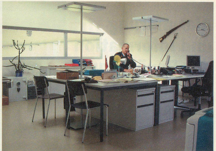
Moderne und helle Büroräume.