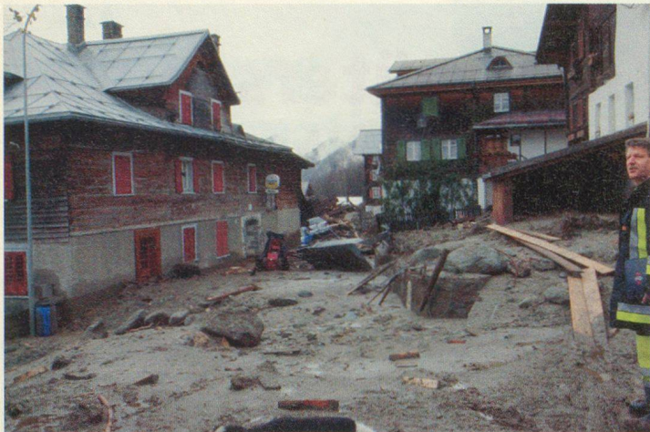
Verwüstungen im Dorfzentrum Schlans.