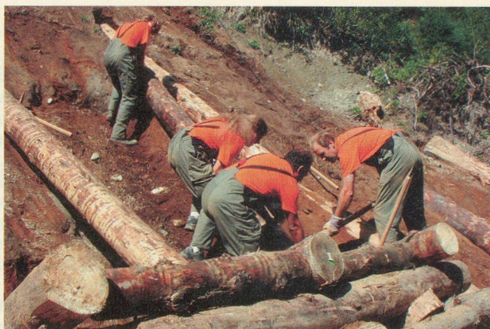
Gute Motivation trotz harter Arbeit.