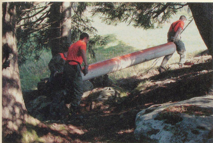
Anpacken beim Verlegen einer Wasserleitung.