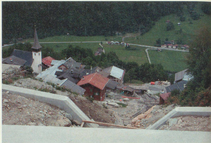
Schlans: neue massive Stützmauern.