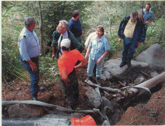
Besuch auf einer der Baustellen.