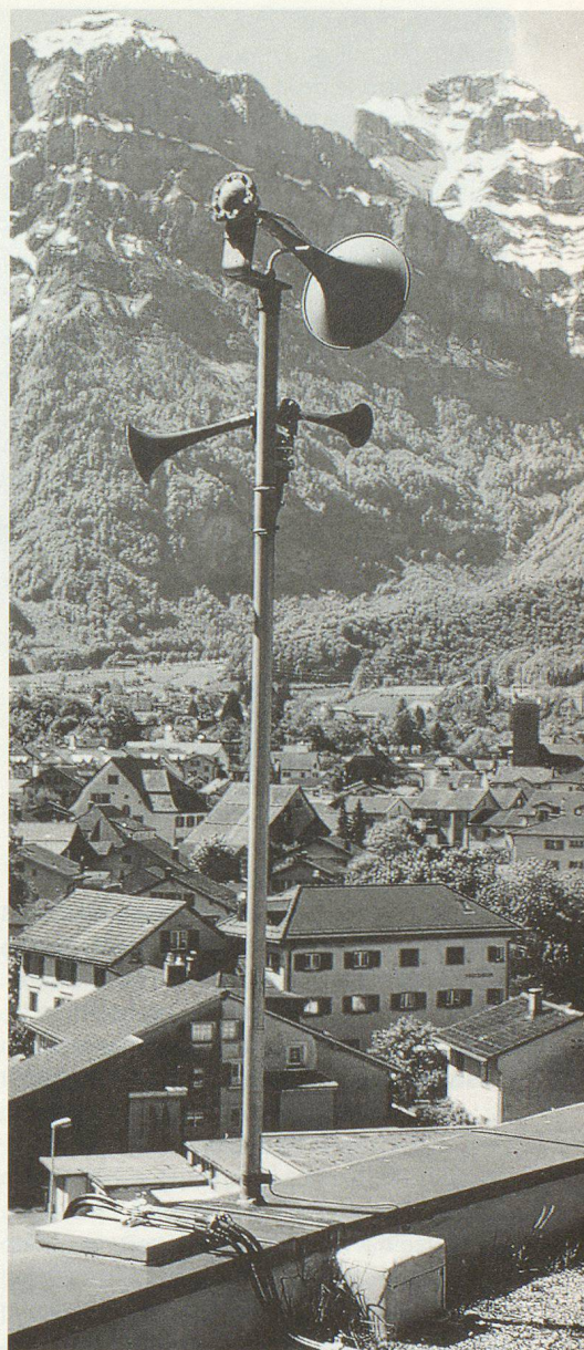
Il 4 febbraio 2004 verranno testate anche le sirene per dare l'allarme acqua.

Si parte dal presupposto che in caso di pericolo sia possibile dare l'allarme ad oltre il 99,5% della popolazione svizzera per mezzo di sirene fisse e mobili. In caso effettivo, gli abitanti di case discoste vengono avvisati per telefono. Per garantire che i segnali raggiun-