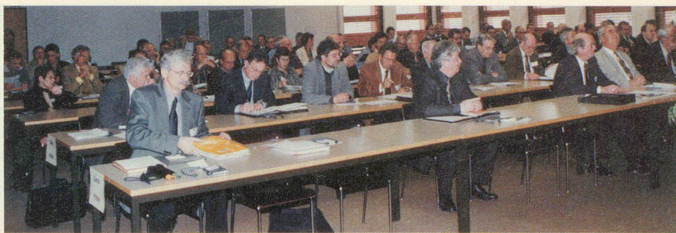
Une assemblée clairsemée.