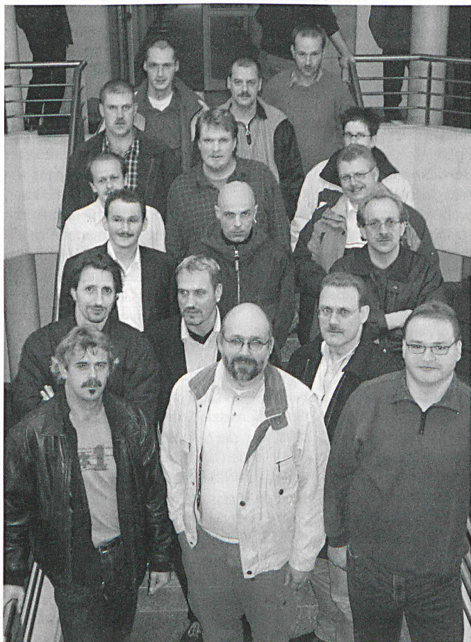
Entlassene und Beförderte des ZSO-Kaders Steffisburg-Zulg.