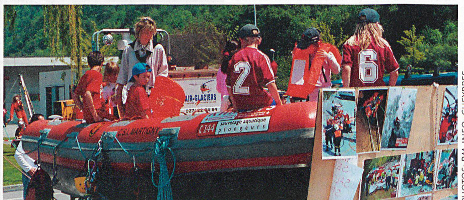
Le bateau des plongeurs du Bas-Valais.