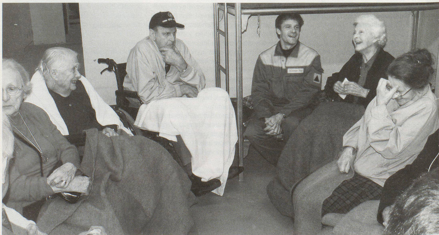
Bewohnerinnen und Bewohner des Alters- und Pflegeheims in der Zivilschutzanlage.

Am grossen Tisch in der Mitte des Raumes sitzen die Spezialisten des Kata-Stabs. Sie studieren Karten, nehmen fiktive Telefone von fiktiven Hausbesitzern entgegen, beraten sich untereinander. Die Kommunikation unter den verschiedenen Rettungsdiensten gestaltet sich schwierig. Die Seeretter sollten darüber informiert werden, dass sich eventuell Schiffe von ihrer Verankerung losgerissen haben. Die Zivilschützer müssen aufgeboten werden, die Verschüttung eines Bachbettes mit Geröll und Schlamm muss behoben werden. Das Dach des Altersheims Platten ist eingestürzt. Zivilschützer müssen eine Notunterkunft für die obdachlosen Alten organisieren und ihre Betreuung gewährleisten. Untergebracht wurden die zehn Senioren, die freiwillig an der Übung teilnahmen, in einer Zivilschutzanlage.