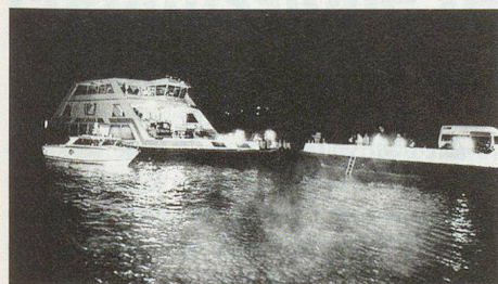
Auf dem havarierten Fährschiff brennen zwei Autos.

Auf der Dorfstrasse in der Nähe der Parkresidenz hat sich ein schwerer Autounfall ereignet: Aufgrund der Unwetter hat ein Autolenker die Kontrolle über sein Fahrzeug verloren und ein anderes Auto gerammt. Leute sind in ihren Wagen eingeklemmt, drei Personen sind schwer verletzt. Natürlich gehört das alles zur Übung. Die Feuerwehr fährt ein, sichert die Unfallstelle und beginnt mit der Rettung der Opfer. Die Simulation wirkt derart echt, dass Autofahrer auf der Seestrasse anhalten und die dramatische Szene erschrocken beobachten. «Was ist denn da los?», fragt eine aufgebrachte Passantin, als sie zwei Figuren (Schauspieler) sieht, die verblüffend