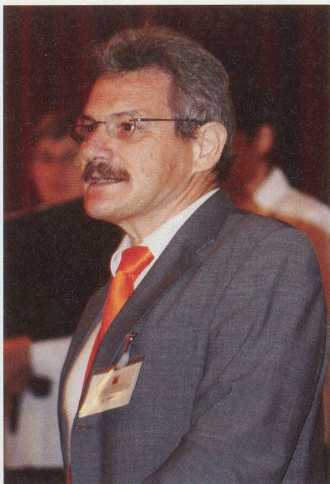
Alfred Vogt, Amtschef des Fürstentums.

Die Delegiertenversammlung des Schweizerischen Zivilschutzverbandes (SZSV) vom 13. Mai im liechtensteinischen Balzers kam dank der Einladung des Amtes für Zivilschutz und Landesversorgung des Fürstentums zustande, zu dem der SZSV seit Jahren beste Beziehungen unterhält.