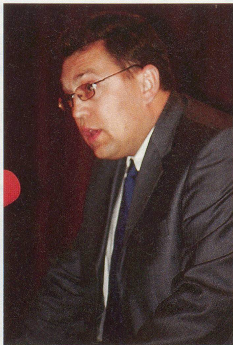
Laurent Wehrli, Zentralpräsident SFV.