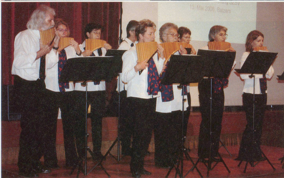
Der Liechtensteinische Panflötenchor umrahmte die Delegiertenversammlung 2006 mit seinen ausgezeichneten Beiträgen.