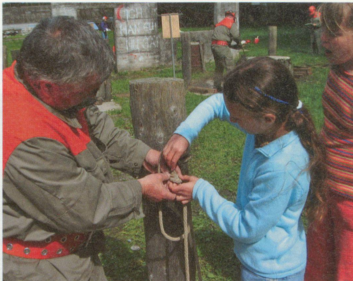
Das Knotenknüpfen will gelernt sein!