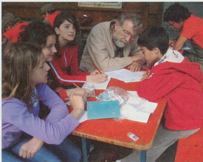
Die Fragen der Theorieprüfung sind ganz schön knifflig.