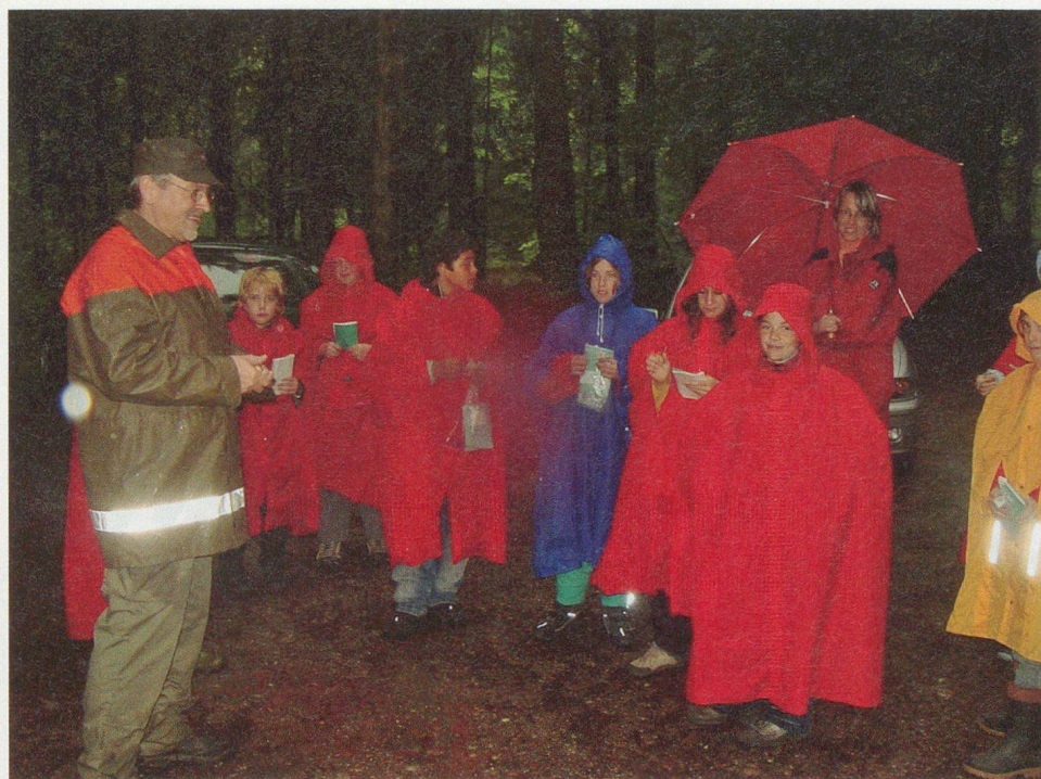
Freundlicher Empfang beim Zivilschutz – dem Regen zum Trotz.

Wir schauten auch den Beleuchtungsmännern zu. Die ausgezogenen Teleskopstangen stellten sie in dreibeinige Metallfüsse. Die Scheinwerfer schlossen sie an ein Aggregat an, das mit einem Benzinmotor Strom erzeugte. Als es zu dunkeln anfang, leuchteten die Scheinwerfer bis ans andere Ufer hinüber. Bald tauchte ein Problem auf. Eine Lampe funktionierte nicht, und es gab keine Ersatzbirne. Deshalb kamen auch Petrollampen zum Einsatz.