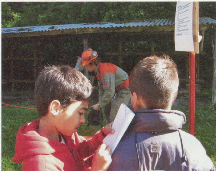
Junge Reporter an der Arbeit.