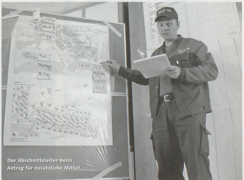
Der Abschnittsleiter beim Antrag für zusätzliche Mittel.