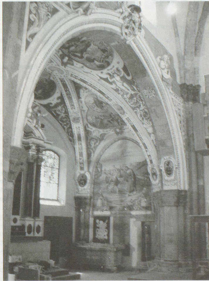
Innenansicht der Churer Kathedrale.

BABS. Wie üblich trafen sich die kantonalen KGS-Verantwortlichen mit den Vertretern des Fachbereichs Kulturgüterschutz zu einem eintägigen Rapport, der in diesem Jahr in Chur stattfand. Hauptthema waren die Arbeiten im Rahmen der Revision des KGS-Inventars, welches 2008 in dritter Fassung erscheinen soll. Dasselbe Thema bildete auch einen Schwerpunkt am diesjährigen Jahresrapport des Schweizerischen Komitees für Kulturgüterschutz in Genf.