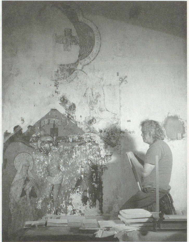
Umfassende Restaurierungsarbeiten im Innern der Kathedrale von Chur.