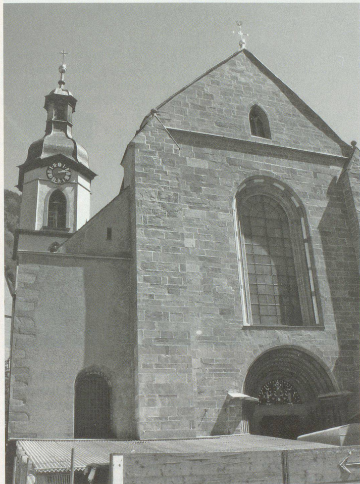
Die Kathedrale in Chur – ein Kulturgut von nationaler Bedeutung.