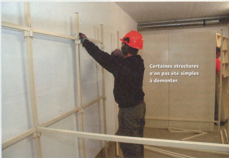
Certaines structures n'on pas été simples à démonter.