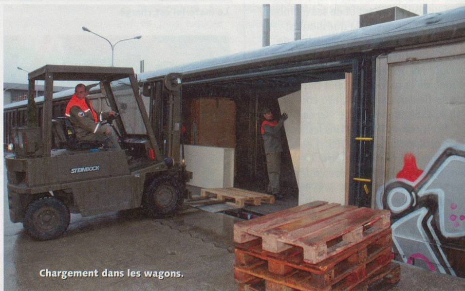
Chargement dans les wagons.