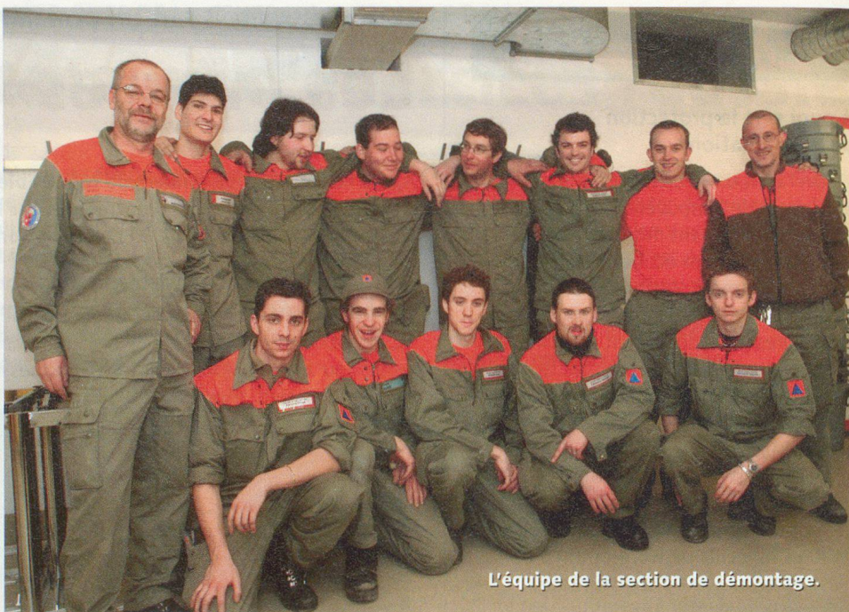
L'équipe de la section de démontage.

Il faudra encore un cours similaire, probablement un peu plus long, pour tout remettre dans l'ordre et des bruits courent quant à une cérémonie d'inauguration qui devrait avoir lieu à l'automne. Voilà un petit exemple de collaboration fructueuse et intelligente entre cantons. □