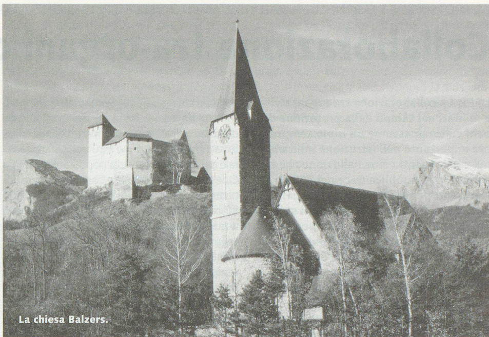
La chiesa Balzers.

La montagna più alta del «Ländle» è il Grauspitz con i suoi 2599 s.m. Si è fatto qualcosa per la salute e il benessere e c'è una buona gastronomia che ha ripreso vari elementi dalle cucine degli stati limitrofi. Se volessimo affrontare più in dettaglio le diverse manifestazioni culturali, i musei, la musica, il teatro e le arti figurative, andremmo troppo in là. Non ci rimane che raccomandare una visita a questo piccolo paese. E per cominciare subito suggeriamo di partecipare per esempio all'assemblea dei delegati dell'Unione svizzera per la protezione civile. □