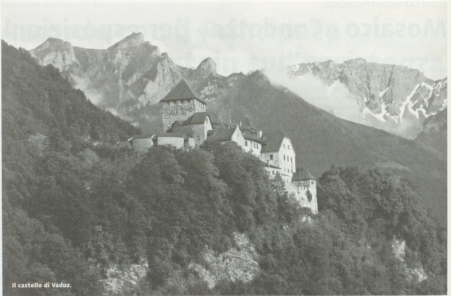
Il castello di Vaduz.

LIECHTENSTEIN – LUOGO DI SVOLGIMENTO DELL'ASSEMBLEA DEI DELEGATI 2006 DELL'UNIONE SVIZZERA PER LA PROTEZIONE CIVILE (USPC)