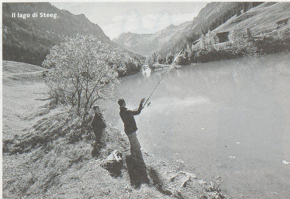
Il lago di Steeg.