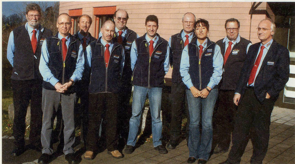
Das POLYCOM-Team vor dem Ausbildungsgebäude in Schwarzenburg.

BABS. Der Erfolg des Projekts Sicherheitsnetz Funk der Schweiz POLYCOM hat Auswirkungen im Ausbildungsbereich: Das Bundesamt für Bevölkerungsschutz BABS konnte im Eidg. Ausbildungszentrum in Schwarzenburg am 4. Dezember 2006 bereits den 100. POLYCOM-Kurs im Jahr 2006 durchführen. Im Frühjahr 2007 wird die Infrastruktur ausgebaut.