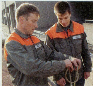
Ein Telematiker unterrichtet Knotenkunde in Langnau.

anlage am Langnauer Bleichweg assen bis zu 100 Leute. Beim «Riz Casimir» beispielsweise bedeutet dies, 20 Liter Suppe, 10 Kilo Kabisalat, 16 Kilo Reis, 17 Kilo Pouletfleisch und über 20 Liter Currysauce zuzubereiten. Für den Material- und Mannschaftstransport