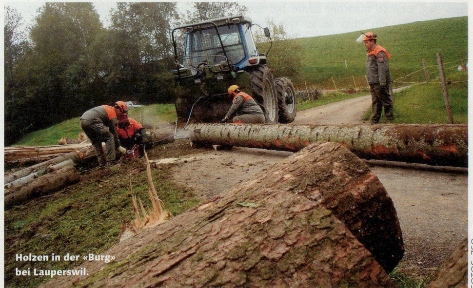
Holzen in der «Burg» bei Lauperswil.

Auch 12 Asylsuchende zogen die Zivilschutzkleider an. Jene Leute, die normalerweise an einem Beschäftigungsprogramm des Schweizerischen Arbeiterhilfswerks teilnehmen, arbeiteten eine Woche lang in der Gemeinde Trubschachen. Für ihr Engagement bekamen die Asylsuchenden viele lobende Worte zu hören. Die Verantwortlichen zogen am Ende der Arbeitswoche ein positives Fazit: Die gesteckten Ziele seien alle ohne Unfall erreicht worden. Die Zivilschutzorganisation Region Langnau, zu der sich alle neun Gemeinden des Amtsbezirks Signau zusammengeschlossen haben, sei jedenfalls für den Ernstfall gerüstet. □