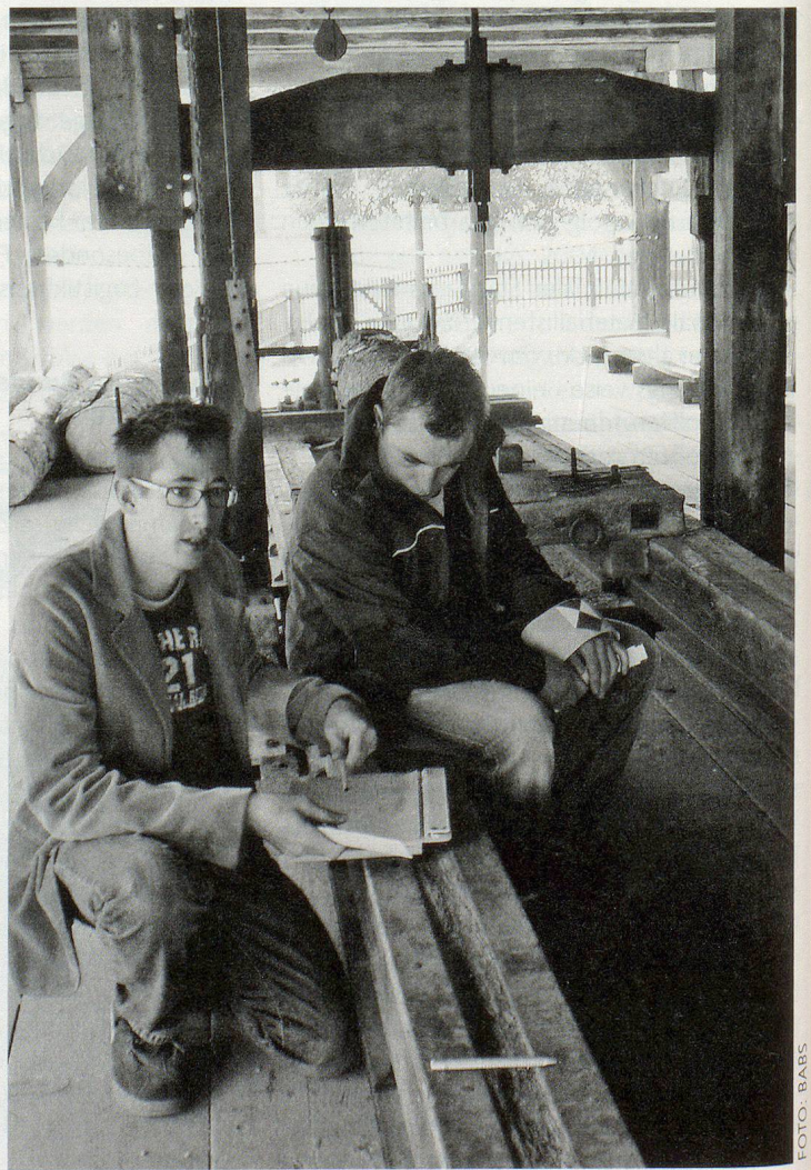
Erstellen des Raumbuchs einer historischen Säge, Kanton Schaffhausen.