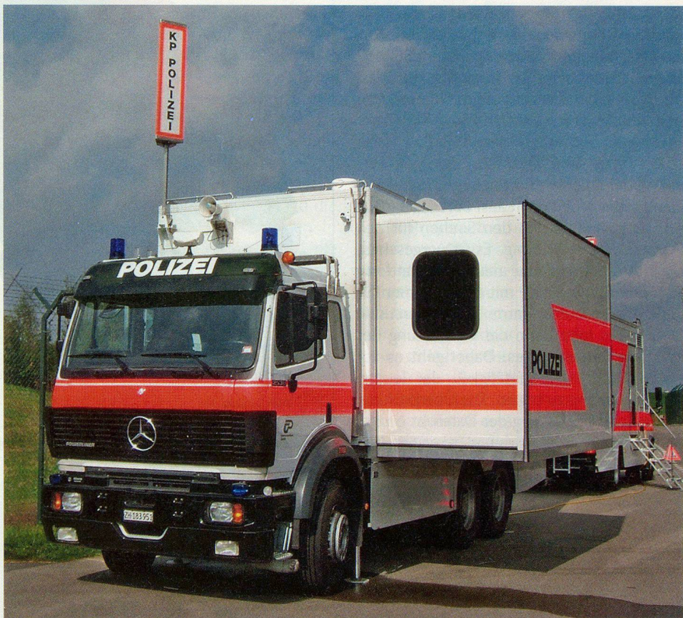
Einsatzführung mit modernsten Mitteln: Den Züspsa-Besuchern wird auch die mobile Einsatzzentrale MEZ der Zürcher Kantonspolizei offen stehen.

Wer sich besonders für den Bevölkerungsschutz interessiert, sollte die Züspsa am Samstag, 29. September, besuchen. Während des