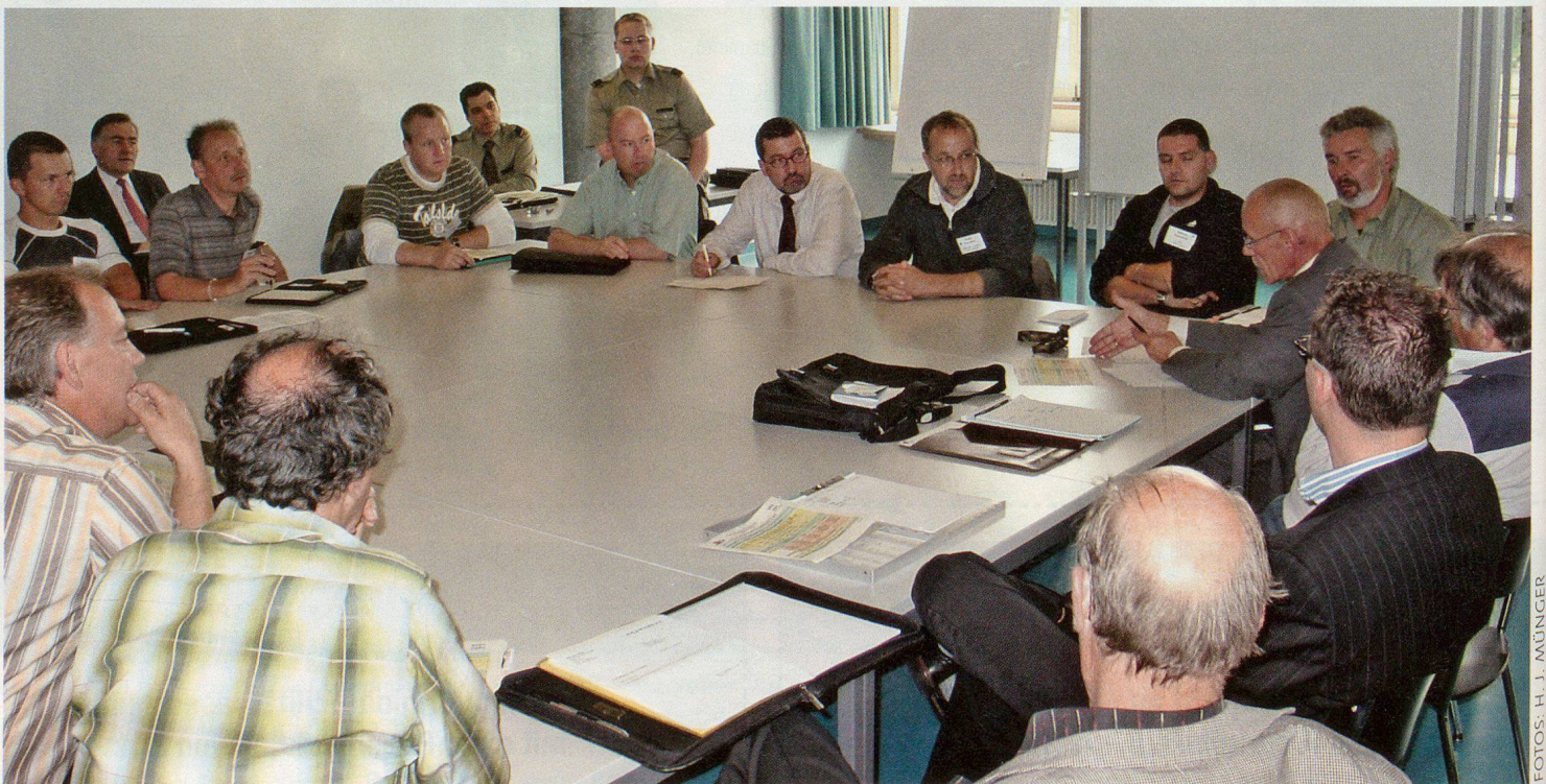
In mehreren Arbeitsgruppen kommen verschiedene «brennende» Themen zur Sprache.

die auch für Laien verständlich waren. Es wurde deutlich: Wir besiedeln immer mehr gefährdete Gebiete oder lösen durch die Besiedlung Gefahren aus. Katastrophen unterschiedlichster Art bis hin zu solchen terroristischen Ursprungs können mit einiger Sicherheit vorausgesagt werden. Gegen viele kann man sich versichern, was oft eine Frage des Preises ist. Auch den Bevölkerungs-, insbesondere den Zivilschutz kann man als «Versicherung» ansehen. Stellt man sich jedoch fatalistisch oder in der Hoffnung auf Solidarität («die anderen werden im Notfall schon helfen») auf den Standpunkt «das alle 500 Jahre zu erwartende Erdbeben wird schon