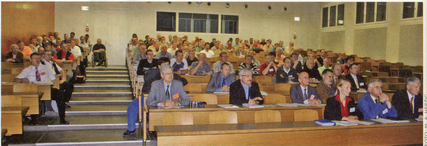
Etwa 140 Kaderleute des Zivilschutzes hören im AAL in Luzern aufmerksam zu und tauschen anschliessend Praxiserfahrungen aus.