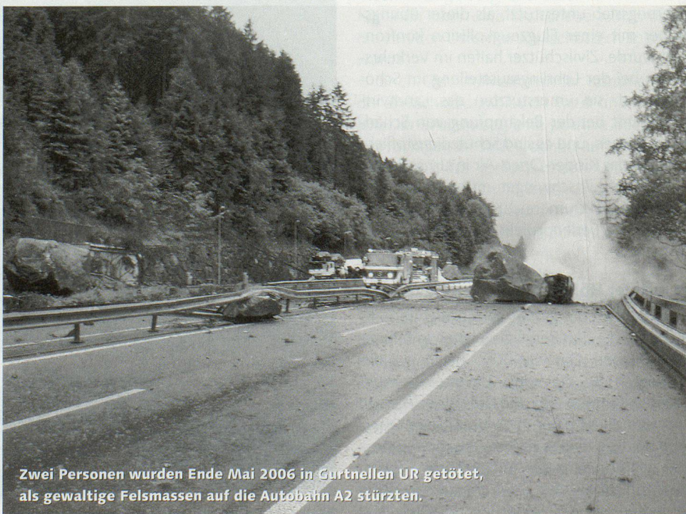
Zwei Personen wurden Ende Mai 2006 in Gurtellen UR getötet, als gewaltige Felsmassen auf die Autobahn A2 stürzten.

Im Jahr 2006 richteten Überschwemmungen, Murgänge, Rutschungen und Felsbewegungen in der Schweiz insgesamt rund 75 Millionen Franken Schäden an. Verglichen mit der durchschnittlichen Schadensumme