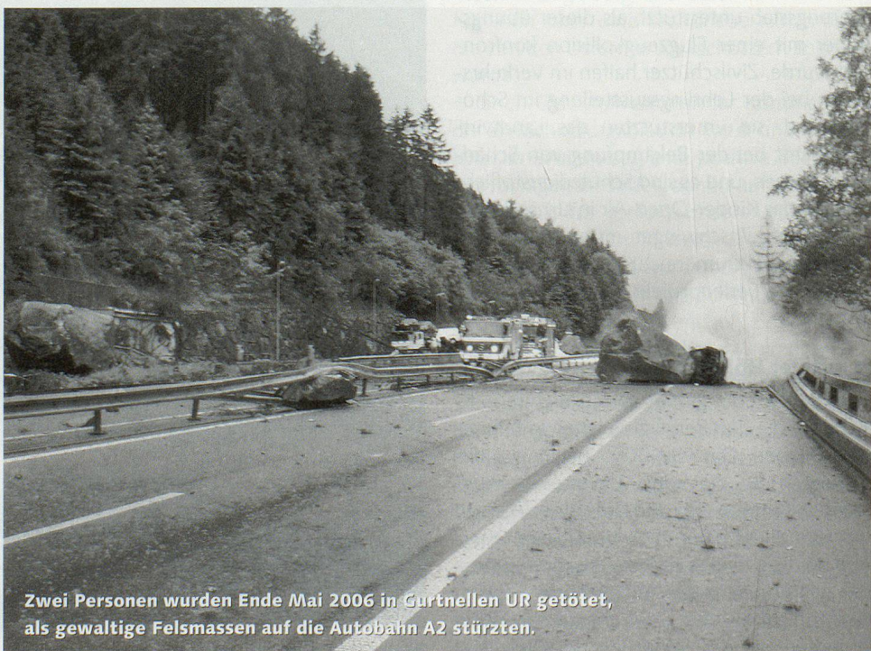
Zwei Personen wurden Ende Mai 2006 in Gurtellen UR getötet, als gewaltige Felsmassen auf die Autobahn A2 stürzten.

Im Jahr 2006 richteten Überschwemmungen, Murgänge, Rutschungen und Felsbewegungen in der Schweiz insgesamt rund 75 Millionen Franken Schäden an. Verglichen mit der durchschnittlichen Schadensumme