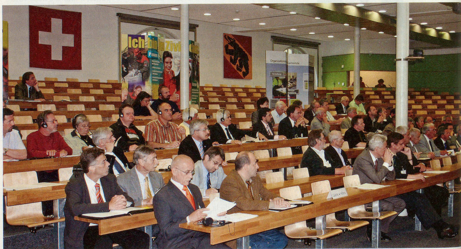
Der ideale Rahmen für die SZSV-DV: Das Auditorium der MK der Berner Truppen.

Ausserhalb des statutarischen Teils befassten sich Delegiertenversammlung und Gastredner praktisch nur mit der Gestaltung der Zukunft. Zentralpräsident Walter Donzé sag-