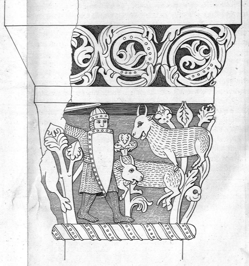
Capitule an den Säulen im Chor.