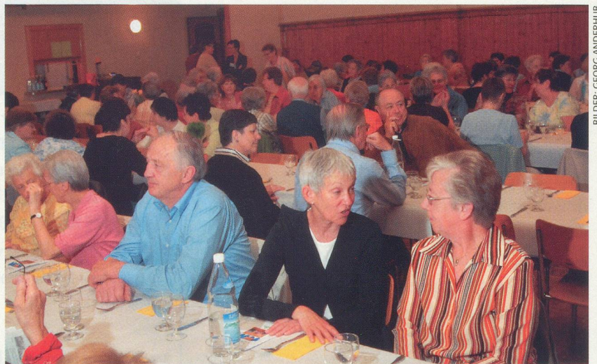
Gut gelaunt: die Helferinnen und Helfer, die sich am 2. Mai im «Rössli»-Saal in Wolhusen zur «Dankeschön-Party» trafen.