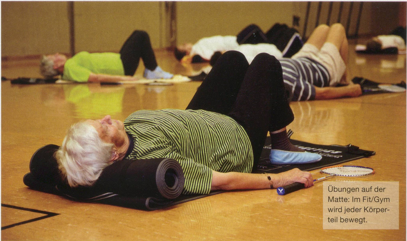
Übungen auf der Matte: Im Fit/Gym wird jeder Körperteil bewegt.

geöffnet werden. In immer schnellerem Rhythmus wird jeder einzelne Finger bewegt – und die Hände schliesslich geschüttelt und gelockert. Ferse-Spitze-Ferse-Spitze: So werden beim Wippen und Strecken auch die Fussgelenke trainiert. Sich im Kreis an den Händen haltend, geben sich die Senioren nun gegenseitig Halt beim Heben, Strecken und Beugen der Füsse und der Beine. Jede Teilnehmerin macht, was ihr möglich ist.