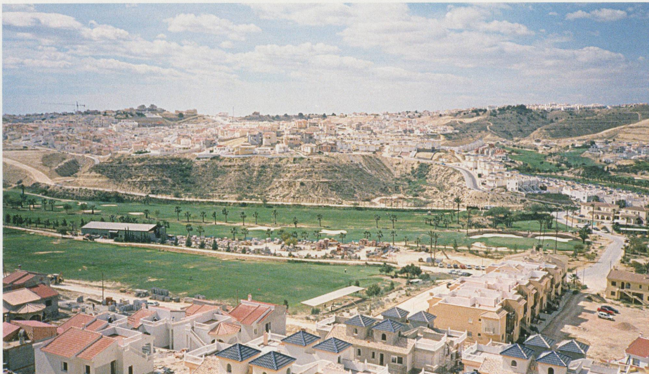
Erweiterung der Riesenurbanisation Ciudad Quesada in der Provinz Alicante mit Golfplatz auf der meerabgewandten Seite.