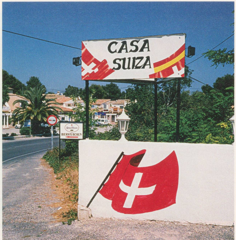
Werbung für ein Schweizer Restaurant in der Nähe von Benissa.

Arbeitsmigranten. Ihre Integration ist weder von Faktoren wie Anstellung, Schulausbildung, Bürgerrechten und der Überwindung diskriminierender Schranken abhängig, noch zeichnen sie sich durch Machtlosigkeit, Marginalisierung sowie einen unterschiedlichen kulturellen Hintergrund aus. Den meisten geht es vor allem um ein möglichst gutes Auskommen mit einem mehr oder weniger unbestimmten «anderen».