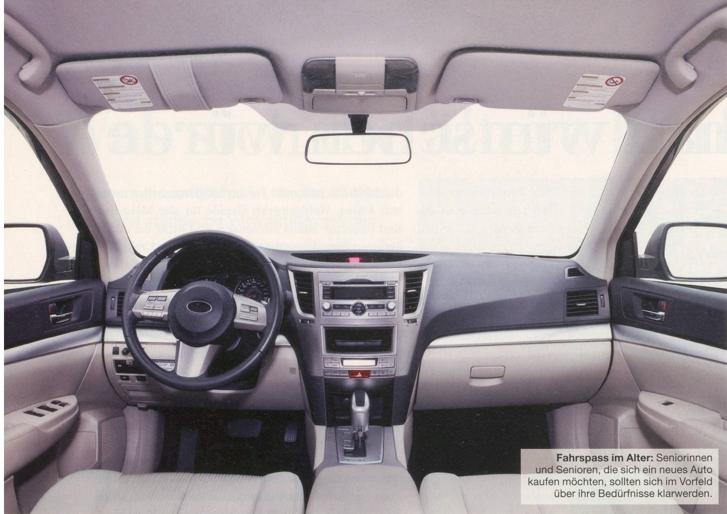
Fahrspass im Alter: Seniorinnen und Senioren, die sich ein neues Auto kaufen möchten, sollten sich im Vorfeld über ihre Bedürfnisse klarwerden.