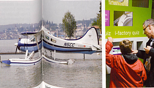
Von der Eisenbahn bis zum Raumfahrtlabor: Das Verkehrshaus