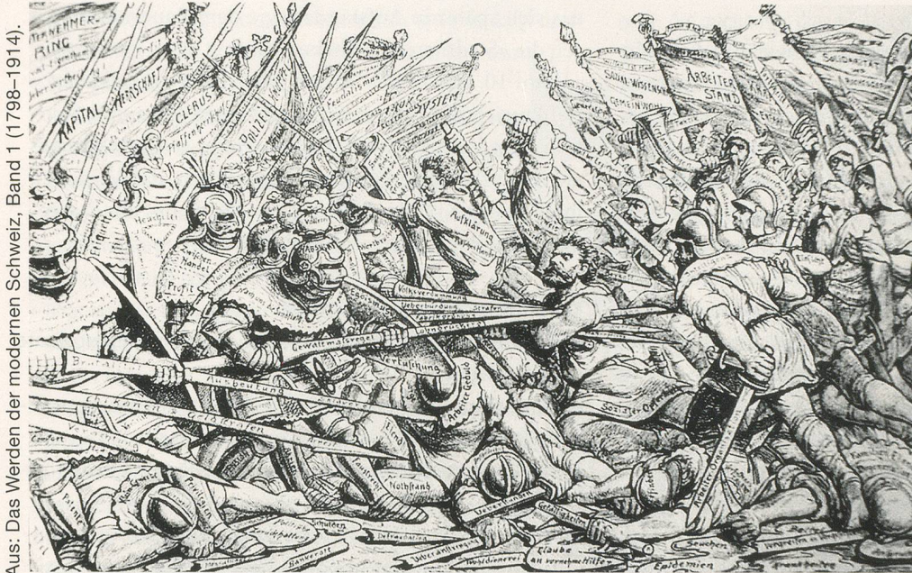
Aus: Das Werden der modernen Schweiz, Band 1 (1798–1914).

Winkelried wird immer wieder «instrumentalisiert»: Hier in einem Flugblatt des «socialdemokratischen Wahlkomitees» zu den Nationalratswahlen 1899.