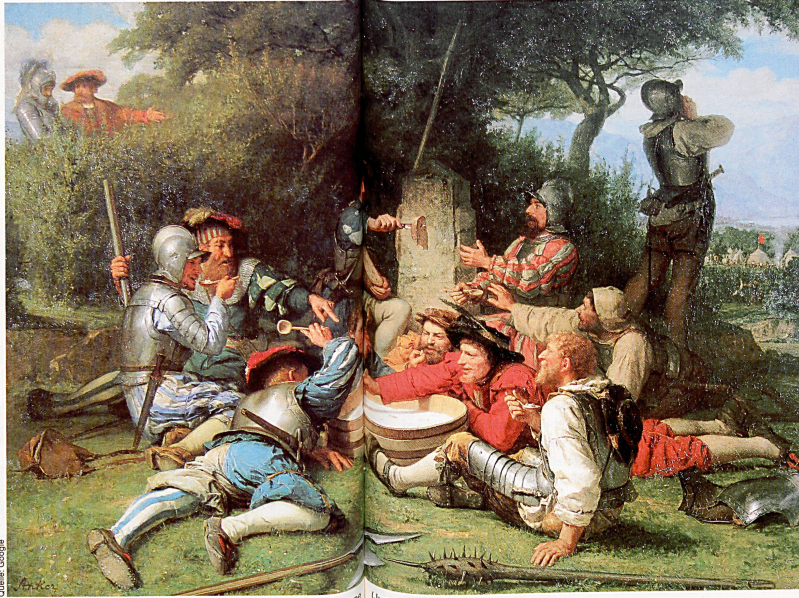
Symbol für die Identitätsfindung der Schweiz: die Kappeler Milchsuppe (Juni 1529) auf einem Gemälde von Albert Anker.

Das typisch Schweizerische an der Reformation Der Bauernsohn Zwingli ist hier vorsichtiger, demokratischer. In Zürich entscheiden nicht die kirchliche Obrigkeit oder Theologen über die Glaubenslehre. Unter Führung der Räte und Zünfte mutet sich hier die weltliche Gemeinde zu, Grundsatzentscheidungen zu fällen. Diese «helvetisch-demokratischen» Züge werden in Deutsch-