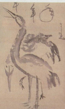
Kraniche (sōkaku) Gibon Sengai (1750-1837)

Seematt Seestrasse 3 6205 Eich 041 462 98 00 info@seematt-eich.ch www.seematt-eich.ch