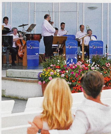
Das Kurorchester Bad Wörishofen