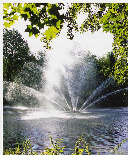
Der Jakobsweiher mit Fontäne im Kurpark