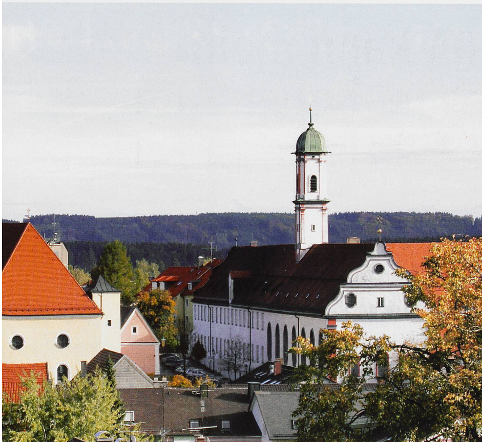
Das Dorfbild von Bad Wörishofen, der Wirkungsstätte des berühmten Pfarrer Kneipp