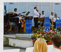
Oben: Das Kurorchester in Aktion Links: Der Rosengarten in voller Pracht

Stöcklin Katalog Im Programm neben Bad Wörishofen auch Abano-Montegrotto, Montecatini und Ischia. Fordern Sie den Stöcklin Katalog 2018 unverbindlich an!