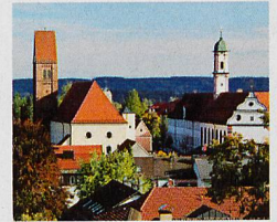
Oben: Ortsbild Bad Wörishofen Links: Aromagarten Bad Wörishofen