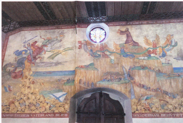
lautet: «Im August 1914, als der Weltkrieg Tod und Verderben brachte, haben wir dich um deine Fürbitte bei Gott angerufen. Lob und Dank in der unteren Ranitkapelle, welches den bereits im Ersten Weltkrieg entstandenen Glauben an die Alpenfestung darstellt.