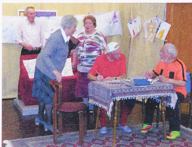
Seniorenbühne mit dem Stück «Herr Gottfried und Frau Stutz».