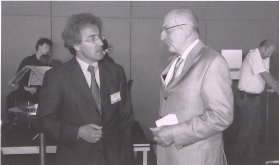
Begegnung auf höchster Ebene: SKOS-Präsident Walter Schmid mit Bundesrat Pascal Couchepin beim Gästeempfang.

Zahlreich sind sie gekommen: Mehr als 500 Gäste haben am 2. Juni in Luzern mit der SKOS den 100. Geburtstag gefeiert – mit starken Worten, erfrischender Kunst und einer Rundfahrt auf dem Vierwaldstättersee. Ein Rückblick in Bildern.