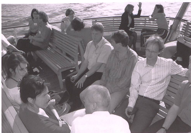
Feiern, reden, geniessen – SKOS-Mitglieder und geladene Gäste auf dem Vierwaldstättersee.