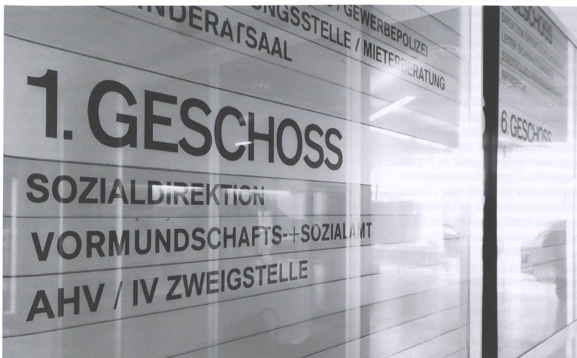
Trendwende in Sicht: Seit Langem erstmals wieder rückläufige Fallzahlen.

Das im konkreten Fall gültige Gesetz erfasse aber explizit nur Familien und keine Konkubinatsverhältnisse. Das Bundesgericht kommt zum Schluss, dass es nicht Aufgabe des Gerichts, sondern Aufgabe des Gesetzgebers ist, das geltende Recht allfälligen neuen Gegebenheiten anzupassen. (pd)