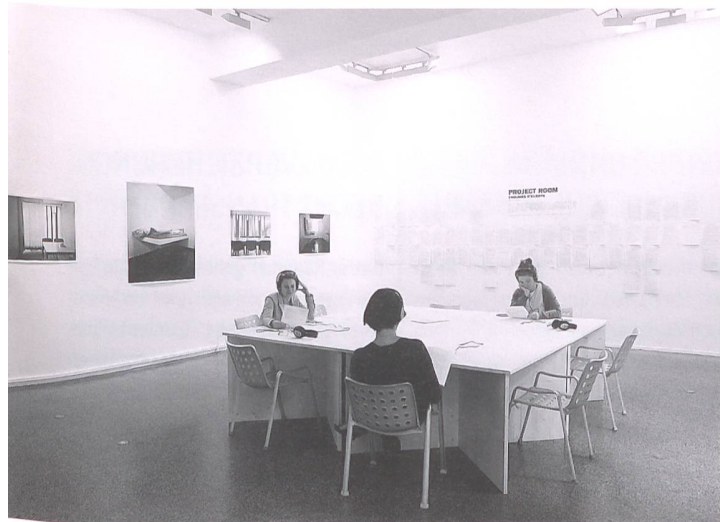
Ausstellung «Enclave d'Europe» im Centre Culturelle Suisse, Paris.

ersten Projekt des Vereins etwa – «Ceil ouvert en prison» – dauerte es ein Jahr, bis eine Gruppe Inhaftierter gefunden und die 80 000 Franken für die Finanzierung zusammengetragen waren. Ist die Zustimmung für eine Zusammenarbeit seitens des Gefängnisdirektors eingeholt, können die Kunstschaffenden und Sahy ihr Projekt den Gefangenen vorstellen. Wie die Auswahl der Gefangenen im Detail erfolgt, bleibt Sache des betreffenden Gefängnisses. Die Mitarbeit ist jedoch für die Häftlinge freiwillig und erfolgt in ihrer Freizeit, weshalb die Arbeiten abends stattfinden müssen. Als Sponsoren engagierten sich bisher u. a. die Loterie Romand, das Migros-Kulturprozent und der Service des Affaires Culturelles de l'Etat de Vaud.