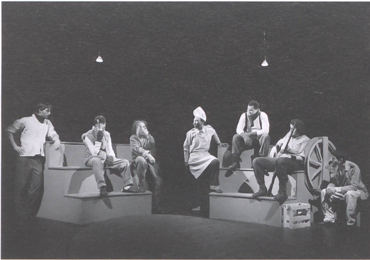
Theaterprojekt «Nulle part mais surtout hors du monde».