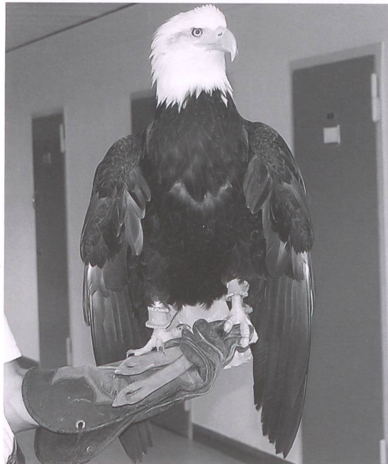
Der zahme Adler «Sherkan», Hauptdarsteller im Kurzfilm «Gros Cauchemar».