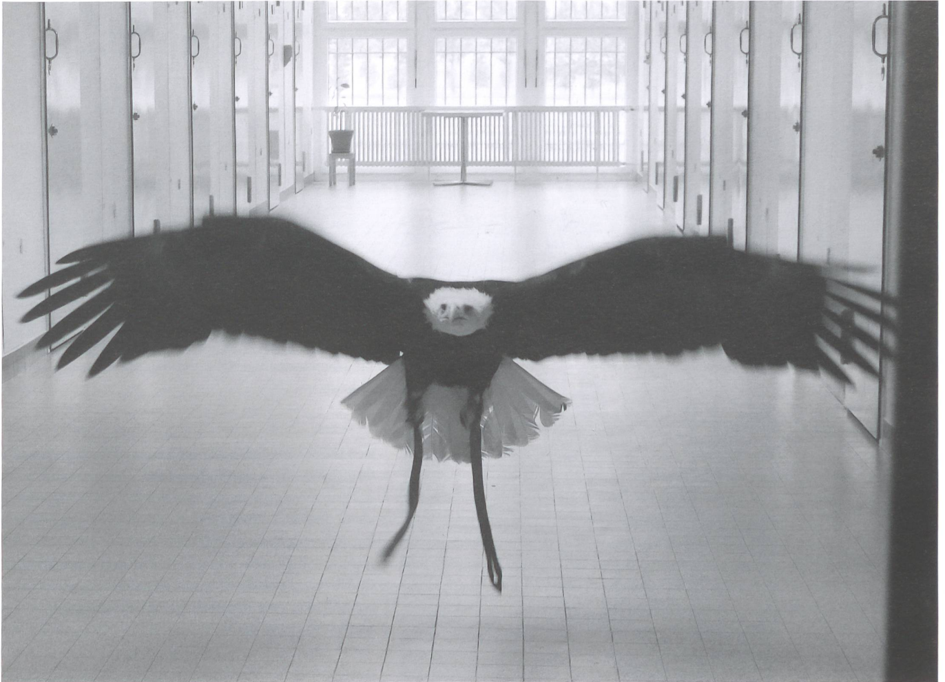
Ein Adler im Gefängnis: Ausschnitt aus dem Kurzfilm «Gros Cauchemar».