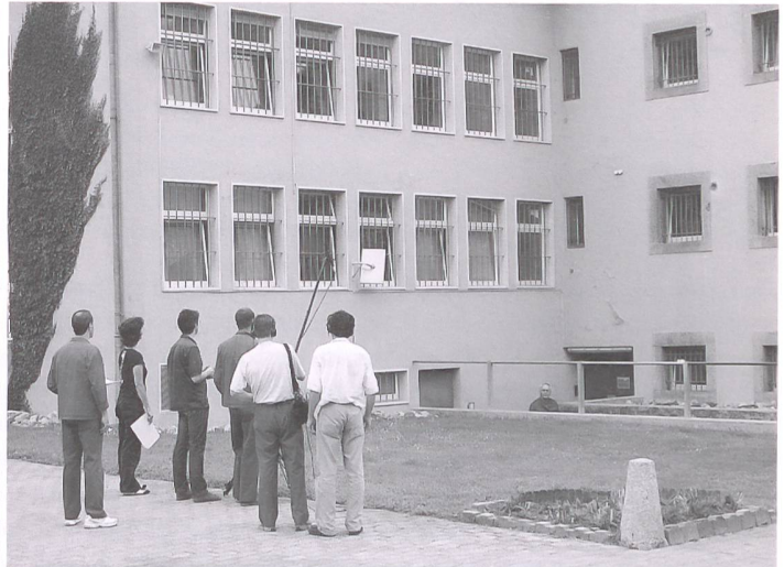
Dreharbeiten mit Insassen der Strafanstalt Etablissements de la plaine d'Orbe.