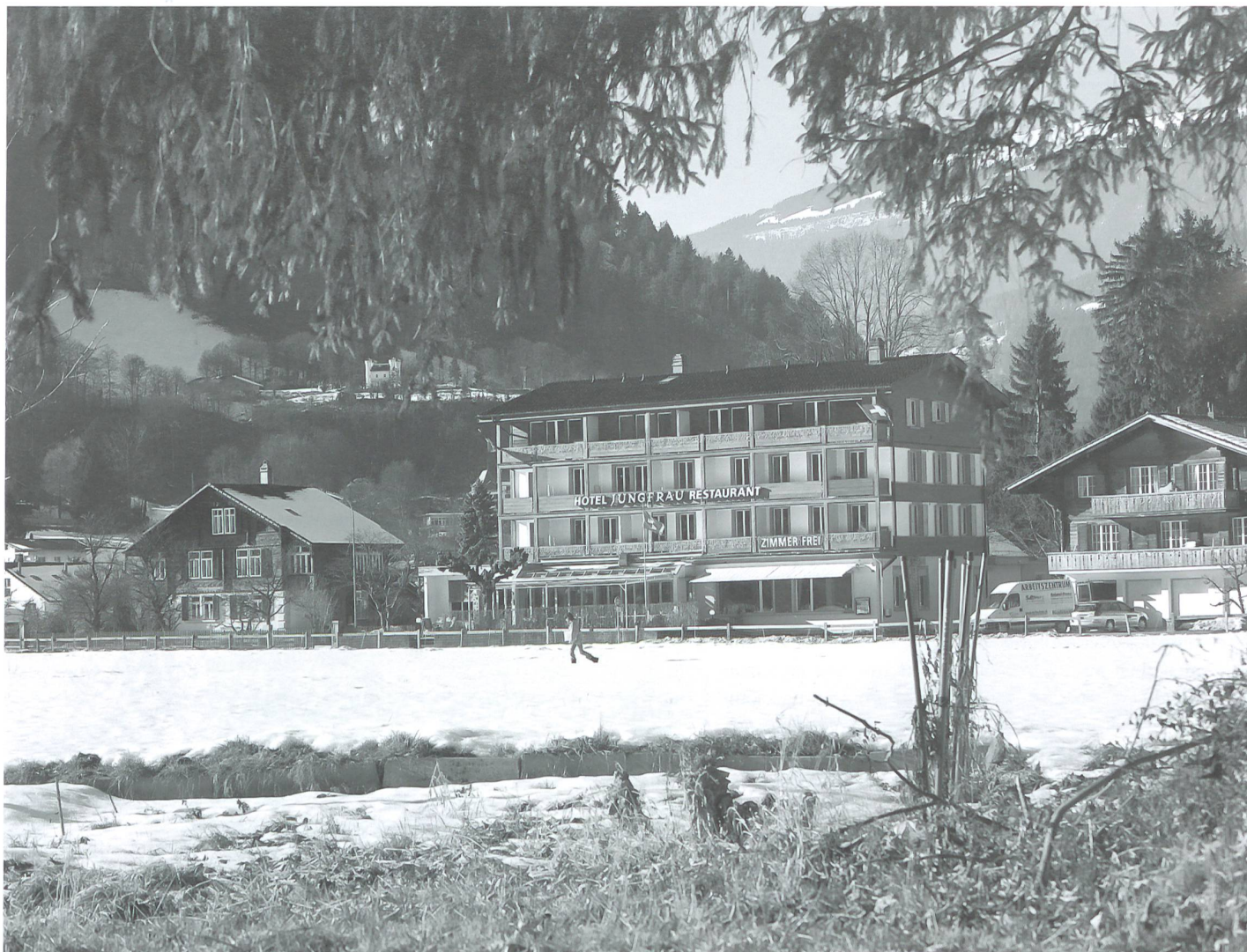
Was auf den ersten Blick wie ein ganz normales Hotel aussieht, ist ein Begegnungsort für Menschen mit und ohne Behinderung.