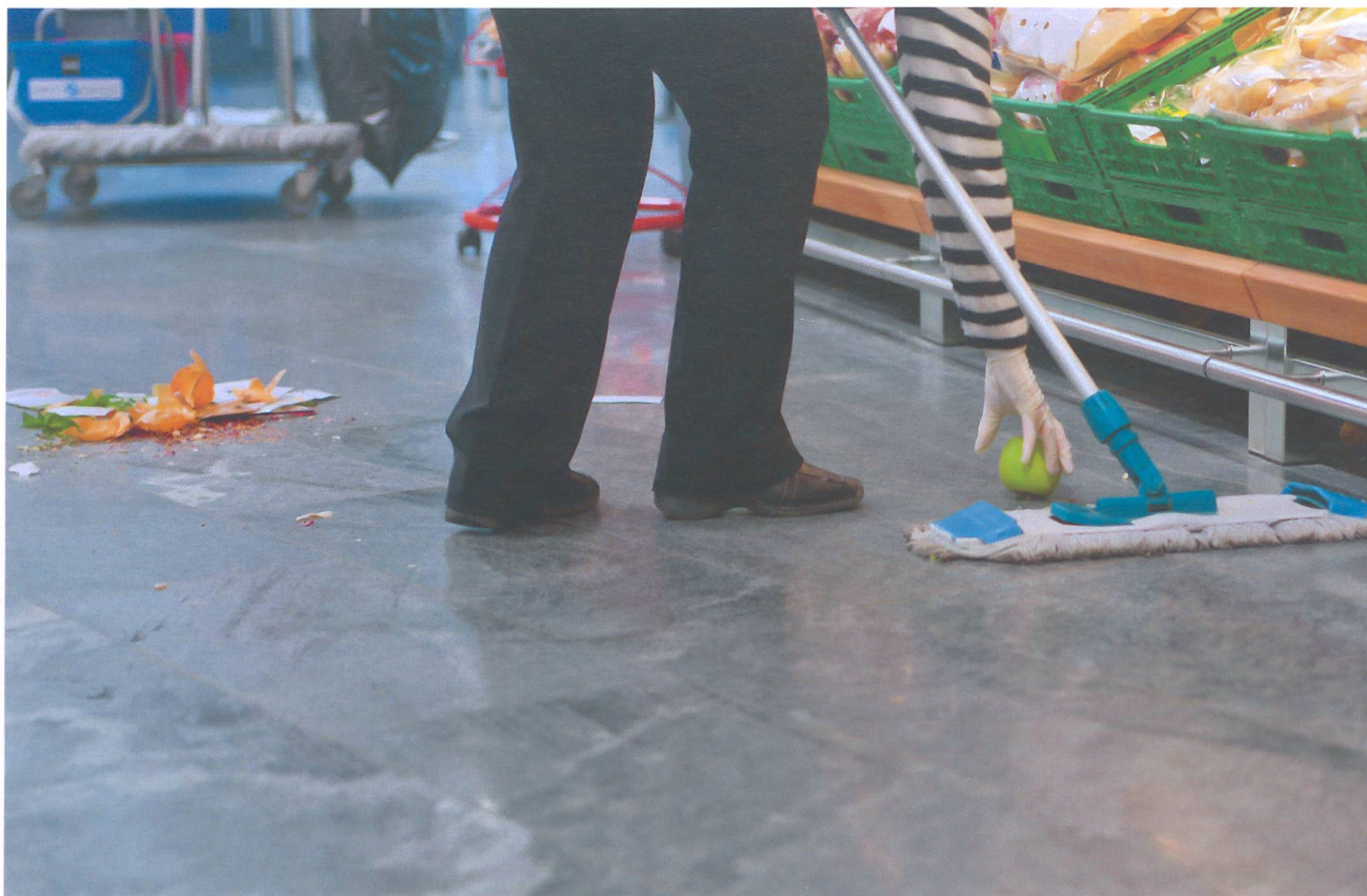
Fairer Lohn für geleistete Arbeit: Die flankierenden Massnahmen sollen dies garantieren.