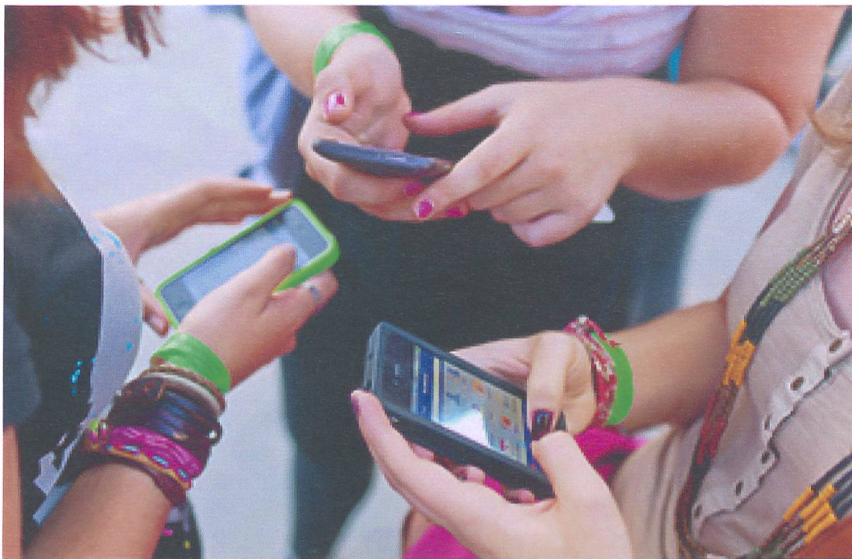
Schnell ist es passiert: Virtuelle Beleidigungen verbreiten sich rasant.