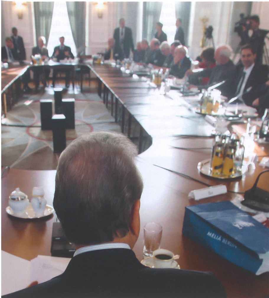
Dialog am runden Tisch.

Der Text wurde von der Redaktion gekürzt.