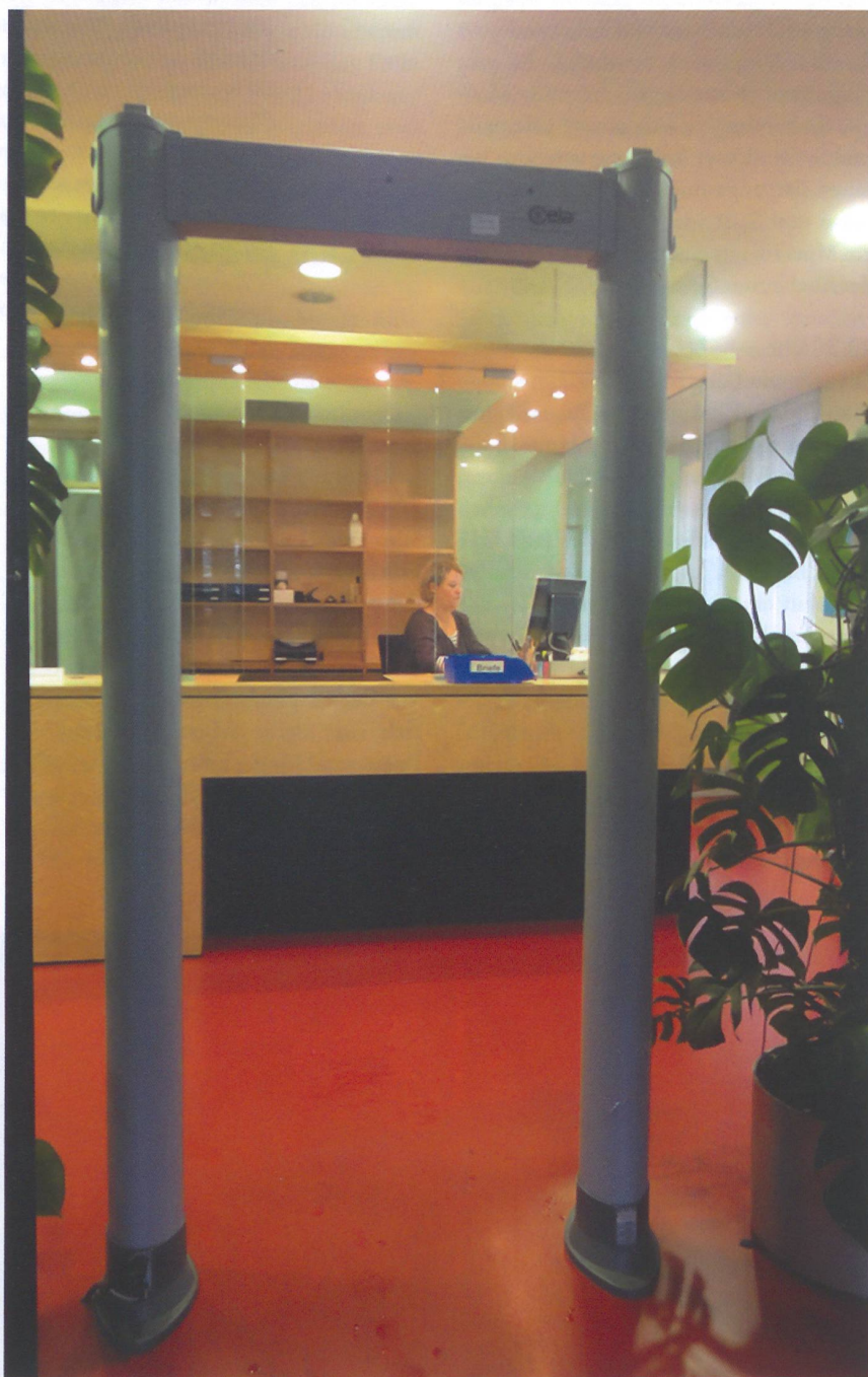
Eingangskontrollen wirken demotivierend.

Die Festlegung der Anspruchsberechtigung beeinflusst die Inanspruchnahme von bedarfsabhängigen Sozialleistungen. Zum Beispiel wird durch die detaillierte Überprüfung der wirtschaftlichen und persönlichen Verhältnisse anstelle eines auf Steuerdaten beruhenden Systems (wie bei der Verbilligung der Krankenversicherungsprämien) die Hürde sehr viel höher gesetzt. Die Wahrscheinlichkeit einer Inanspruchnahme sinkt,