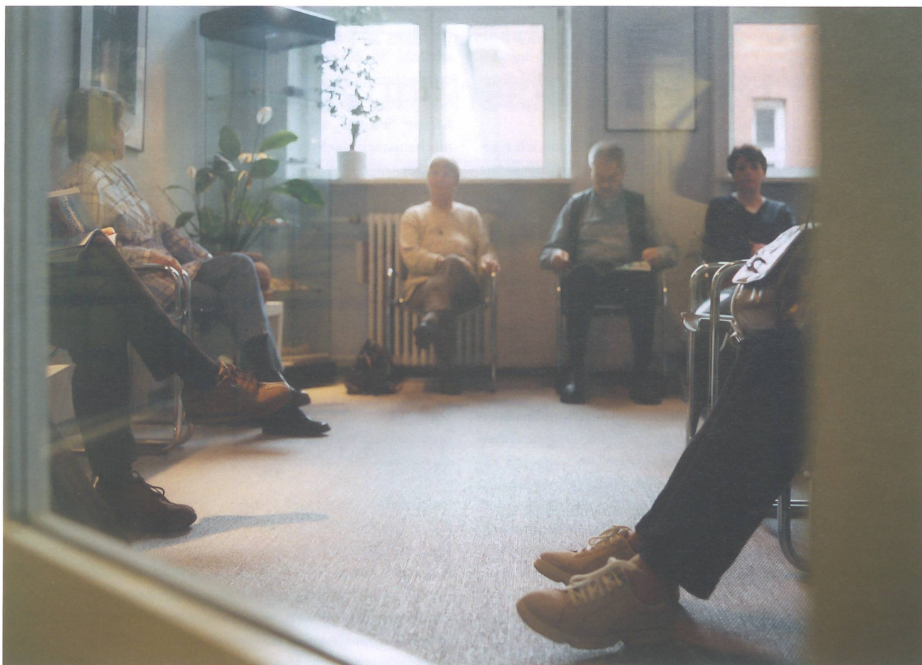
15 Prozent der Genfer Bevölkerung verzichtet gemäss einer Studie aus ökonomischen Gründen auf Gesundheitsleistungen.