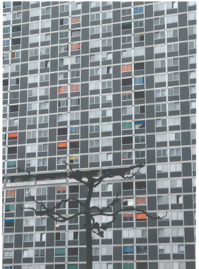
Ein statistischer Blick «hinter die Fassaden».

Die Charakterisierung der Gruppe der alleinlebenden Sozialhilfeempfängerinnen und -empfänger erfolgt anhand der im Rahmen der Sozialhilfeempfängerstatistik erhobenen soziodemografischen Merkmale. Ein Vergleich der Merkmale von Alleinlebenden mit den Nicht-Alleinlebenden beziehungsweise mit der Gesamtheit aller Hilfebeziehenden kann unterschiedliche Verteilungen von Armuts- beziehungsweise Sozialhilferisikofaktoren aufzeigen. Bezüglich des Geschlechteranteils ist ein deutlicher Unterschied erkennbar: Die Gruppe der Alleinlebenden umfasst mit 62 Prozent mehrheitlich Männer, in Mehrpersonenhaushal-