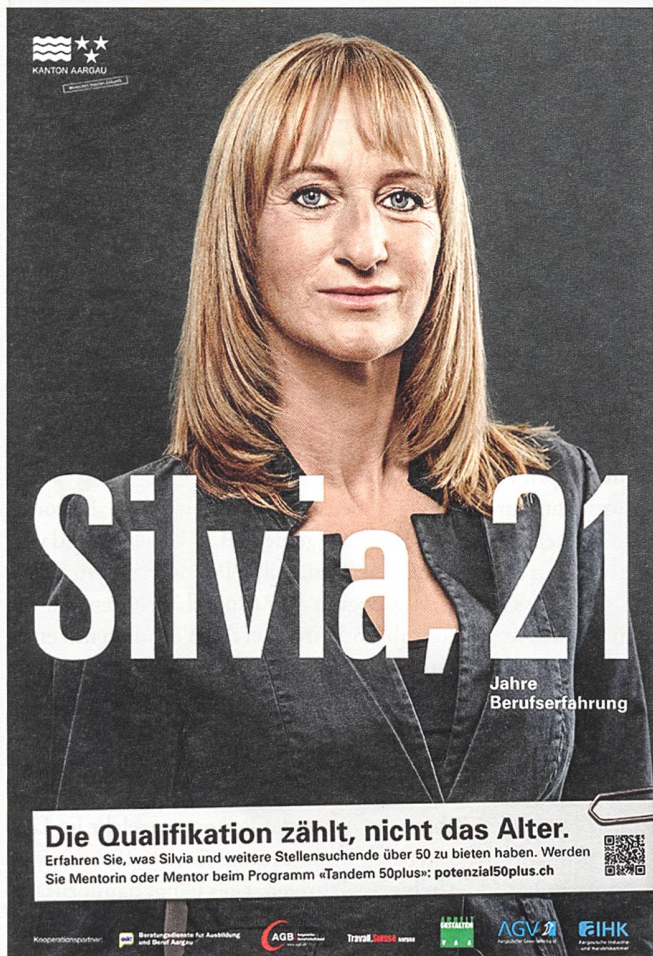
Plakat der 2016 gestarteten Kampagne «Alter hat Potenzial», mit der der Kanton Aargau das brachliegende Potenzial älterer Arbeitskräfte proaktiv erschliessen will.

ten Kantone weiterhin punktuell und ungenügend sind. Insbesondere strategische Bildungsziele für ältere Arbeitssuchende und der Fokus auf die soziale Integration seien dringlich. Zudem fehlen oftmals spezifische Angebote für die neuere Gruppe der gut ausgebildeten Sozialhilfebeziehenden. Aufgrund ihrer breiten Qualifikationen wird von ihnen vermutet, dass sie keine spezifische Unterstützung benötigen. Der soziale Abstieg hat aber oftmals verheerende Spuren hinterlassen, die eine professionelle Begleitung auch erforderlich machen können.