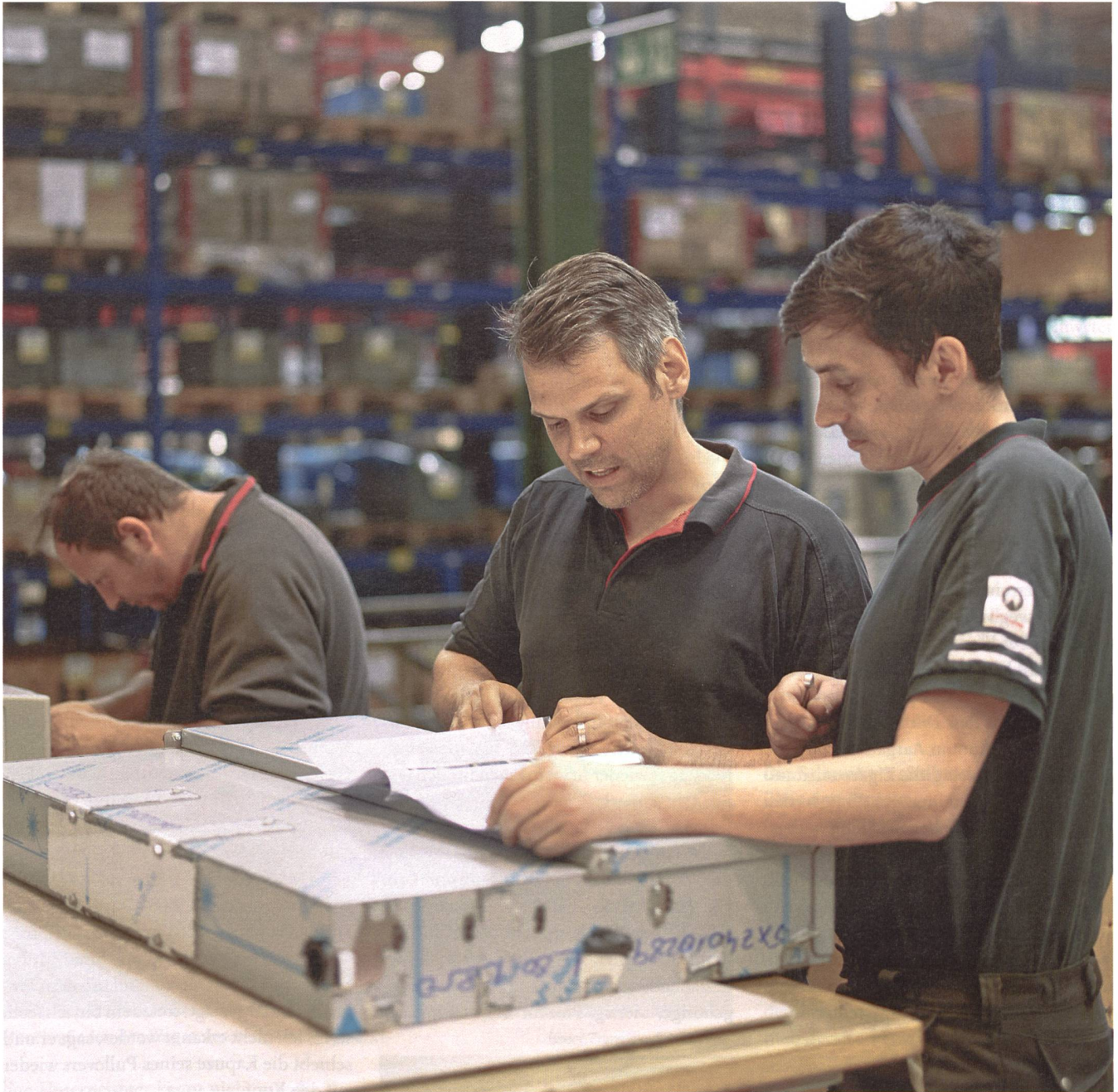
Arbeiten unter Anleitung eines Arbeitsagogen: hier bei der Firma Schindler in Ebikon.