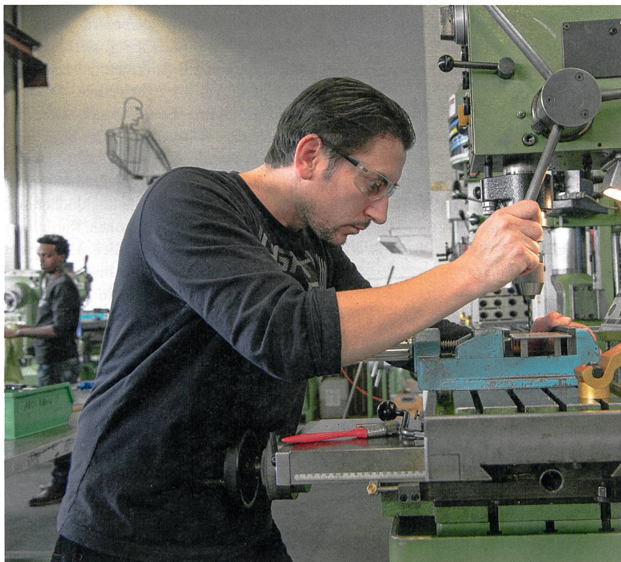
Es sind oft nichtpekuniäre Anreize, die zur Erwerbsarbeit motivieren.